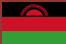
Drapeau du Malawi.